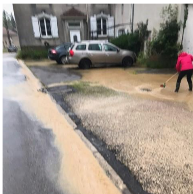
Rampont le 22/06/2024