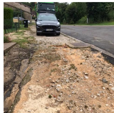
Rampont le 14/08/2024