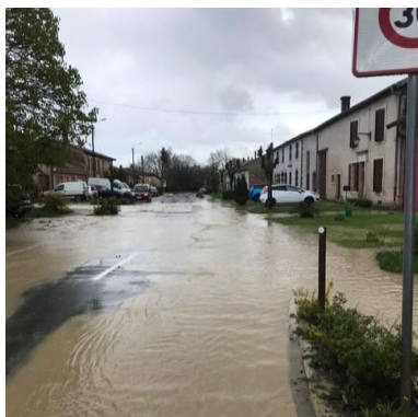
Souhesmes-la-Grande le 04/04/2024

D'autres travaux d'envergure et réaménagements devront suivre. Cela impactera le budget et en modifiera les priorités.